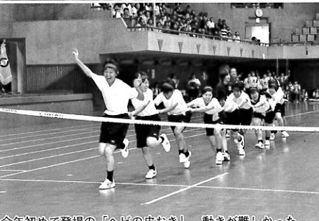
今年初めて登場の「ヘビの皮むき」 動きが難しかった