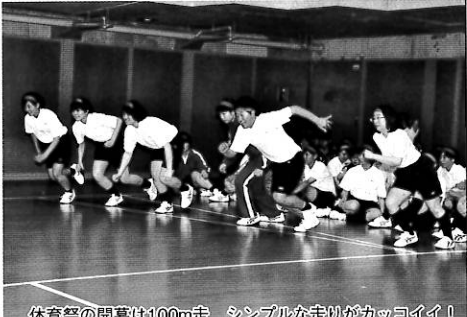
体育祭の開幕は100m走 シンプルな走りがかっこイイ!