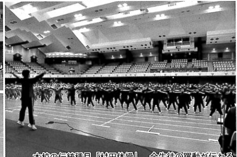
本校の伝統種目「村田体操」 全生徒の躍動が伝わる