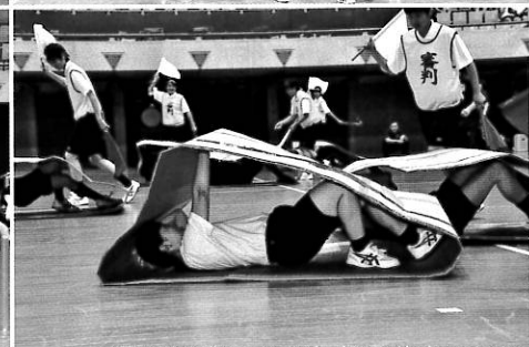
孤独な競技「キャタピラ」 何しろ前がみえません