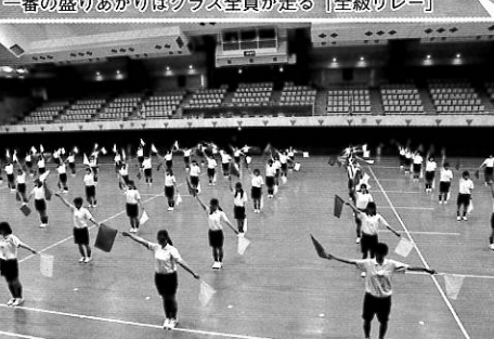
3年生のダンスは一人ひとりが旗手になり女性の美を表現 お見事!