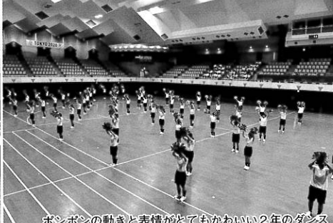
ボンボンの動きと表情がとってもかわいい2年のダンス