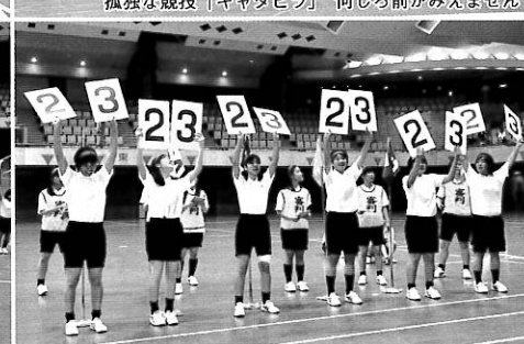
本校の歴史を物語る「読上暗算」 走りながら計算します