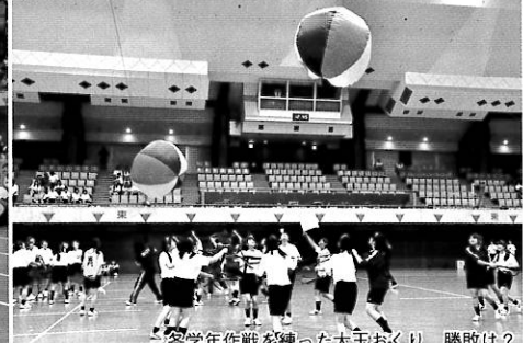
各学年作戦を練った大主おくり 勝敗は?