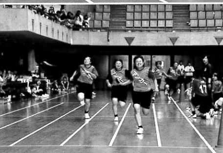
一番の盛り上がりはクラス全員が走る「全級リレー」