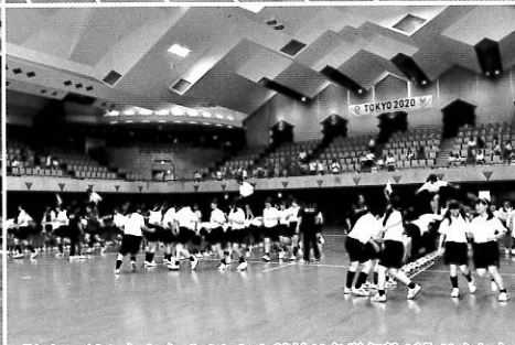
「矢切の渡し」と名づけられた競技は各学年熱が入りました