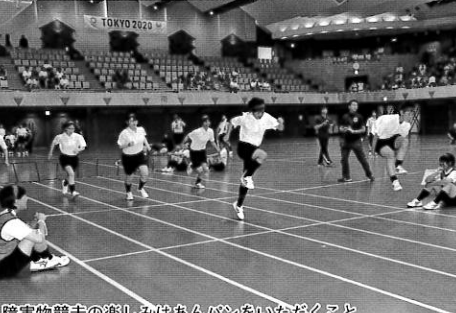
障害物競走の楽しみはあんパンをいただくこと