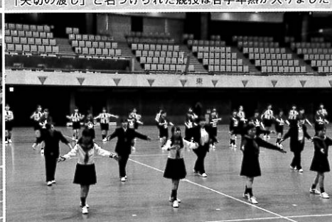
3年の学年全体の応援 心がひとつになり美しい